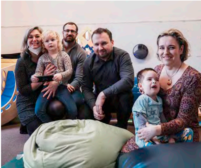
Ministr práce a sociálních věcí na setkání s rodiči hendikepovaných dětí.