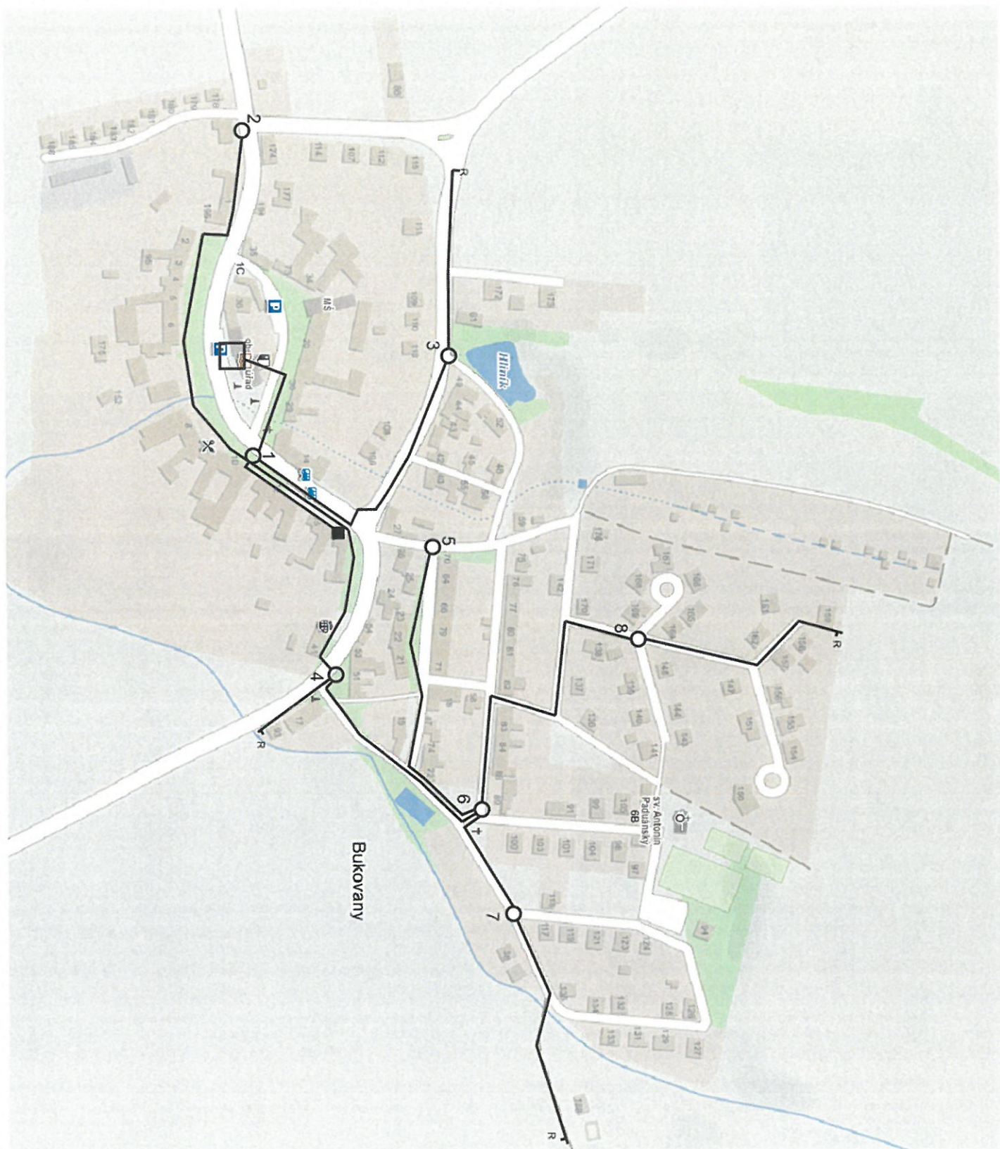
Obr. 2 - páteřní trasy mikrotubiček HDPE 7/3.5mm z central office k rozvaděčům - 1.6.2020